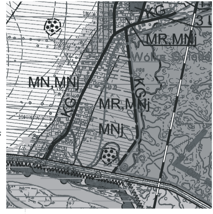
WYRYS ZE STUDIUM UWARUNKOWAŃ I KIERUNKÓW ZAGOSPODAROWANIA PRZESTRZENNEGO GMINY PUŁAWY Skala 1:10000