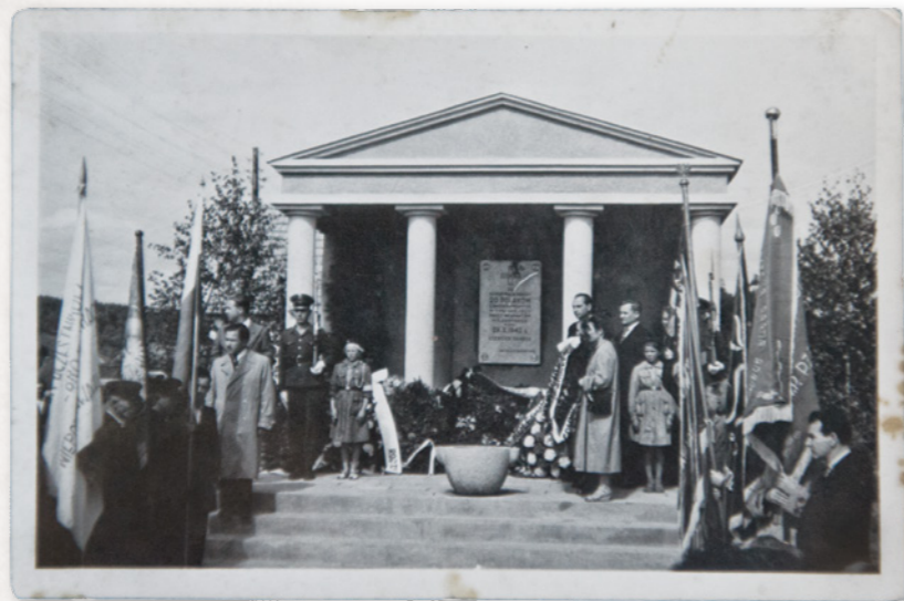
Fotografia z odstonięcia pomnika