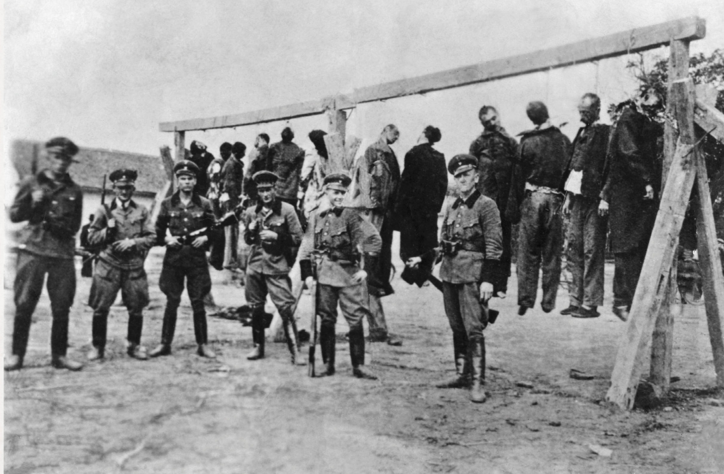
Zdjęcie, które przez lata było uznawane za dokument egzekucji w Górze Puławskiej

Nie jest to prawdą. Nie wiemy, skąd pochodzi to zdjęcie , w kilku publikacjach pojawiło się właśnie ono z różnymi podpisami: „Łódź Bałucka, 9 listopada 1939” – taki opis znajduje się na portalu internetowym Muzeum Niepodległości; w książce Lesława Gnota Lubelszczyzna. Dzieje. Ludzie. Krajobrazy , Wydawnictwo Lubelskie, 1974. jest ono podpisane: „Jedna z pierwszych egzekucji w Zamościu”. Tygodnik „ Za wolność i lud ” nr 14(275) 1966 r. zamieścił artykuł, w którym dementuje informację o zrobieniu tej fotografii w Górze Puławskiej w 1942 roku.