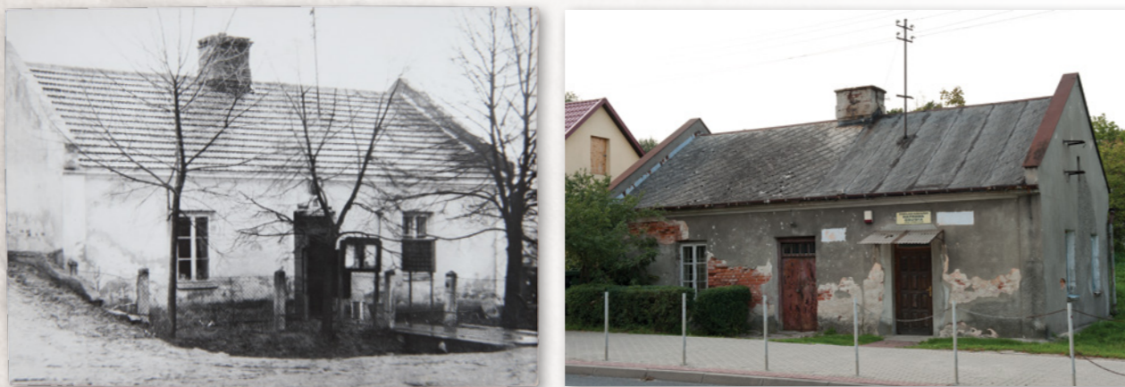
W tym budynku w czasie okupacji mieścił się areszt. To tu, w pomieszczeniu „od podwórka” przebywali zatrzymani zanim przewieziono ich do więzienia w Radomiu. Stąd również odprowadzeni zostali pod szubienicę. Fotografia po lewej pochodzi z lat sześćdziesiątych XX w. Po prawej zdjęcie współczesne. Po wojnie budynek był siedzibą Gromadzkiej Rady Narodowej. Dziś znajduje się tu zakład szewski.