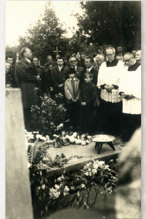
Poświęcenie symbolicznego grobu ofiar egzekucji 1942 r. na cmentarzu w Górze Puławskiej