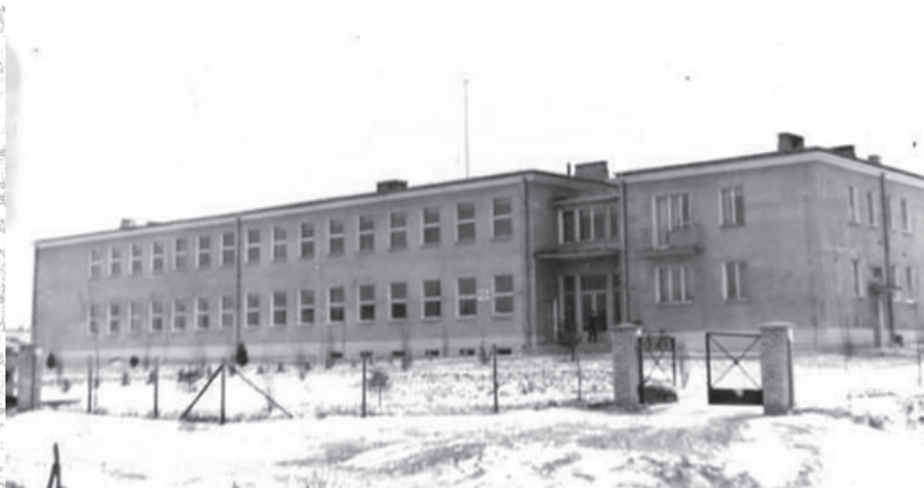
Obecny budynek Szkoły Podstawowej, oddany do użytku w roku 1963. Zdjęcie z lat 60.