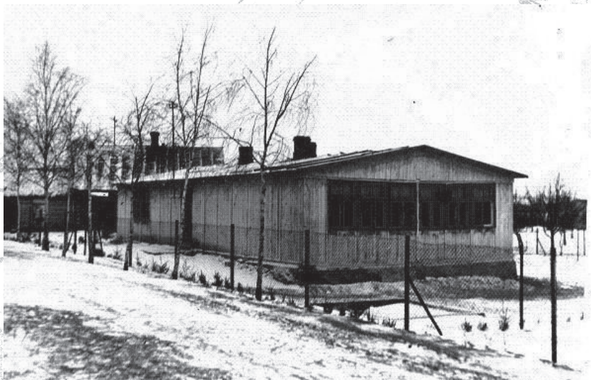
Poniemiecki barak, w którym mieściła się Szkoła Podstawowa w Borowej