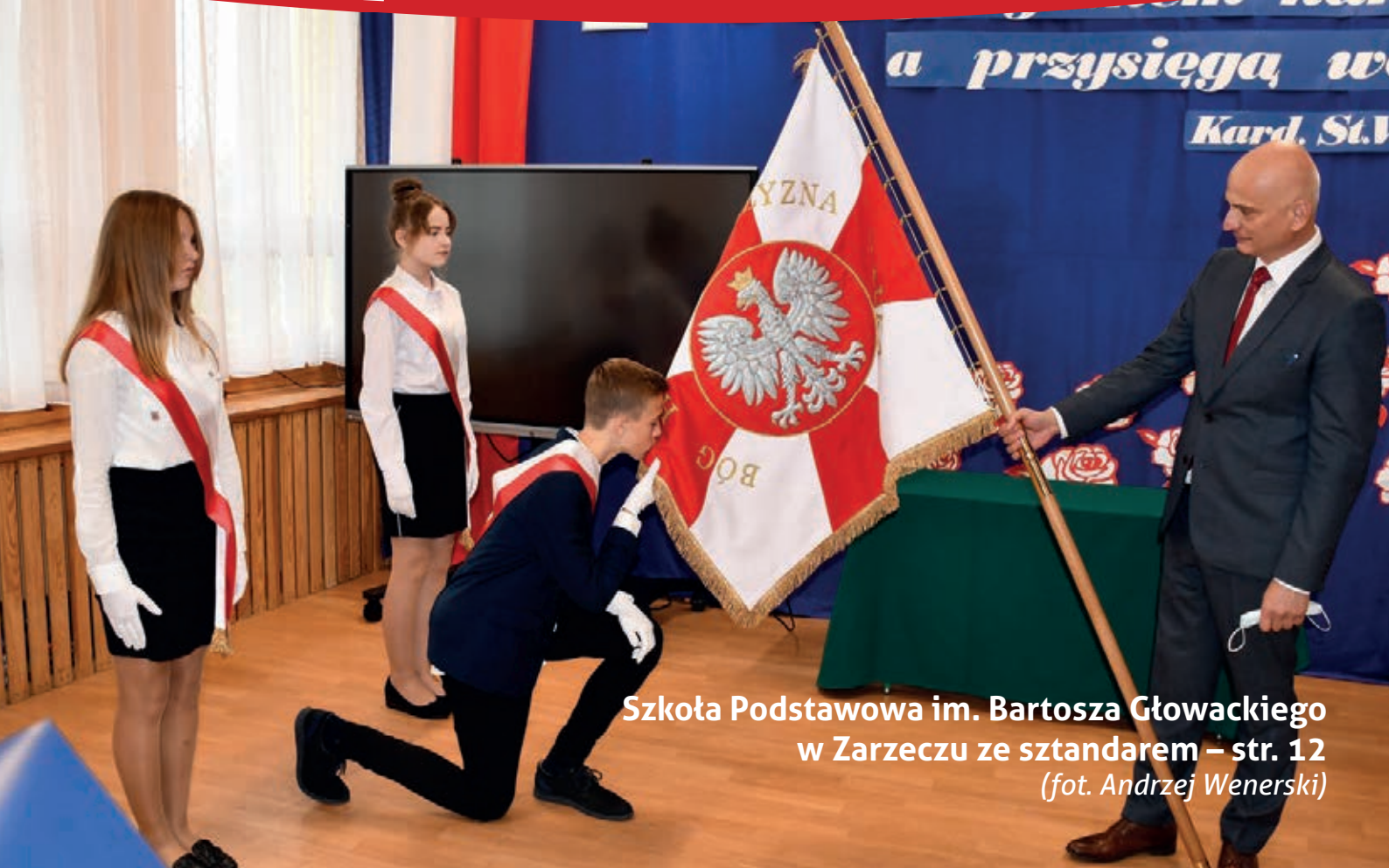
Szkoła Podstawowa im. Bartosza Głowackiego w Zarzeczcu ze sztandarem – str. 12

Z okazji Świąt Bożego Narodzenia składamy najserdeczniejsze życzenia – dużo zdrowia, pogody ducha, wytrwałości i nadziei na lepsze jutro. Wielu miłych chwil spędzonych w gronie rodziny i przyjaciół przy wigilijnym stole. Niech Nowy 2022 Rok przyniesie więcej wiary, wszelkiej pomysłowości i spełnienia marzeń. Wesołych Świąt i Szczęśliwego Nowego Roku!